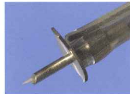
WS-56.30P 20Gインフュージョン付 照明プローブP