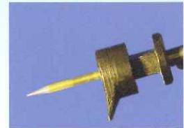
WS-56.50.25P Awhシャンデリア 照明プローブP