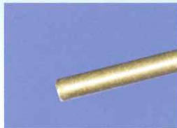
WS-56.02.25P 25Gスティッフシャフト 照明プローブP