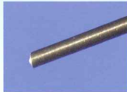
WS-56.21.25PS 25Gスティッフシャフト WF照明プローブP