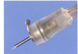
WS-56.30.25P 25Gインフュージョン付 照明プローブP

医療用具承認番号 : 21000BZY00380000 医療用具許可番号 : 13BY6309