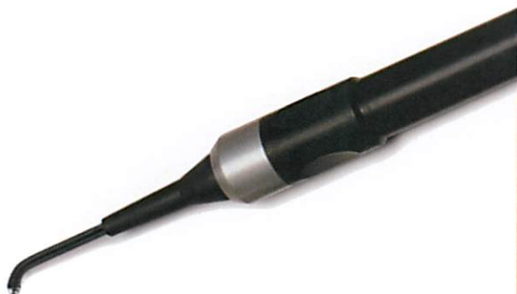
20711-089 網膜剥離用 3.0mm φ 90°・温度表示有