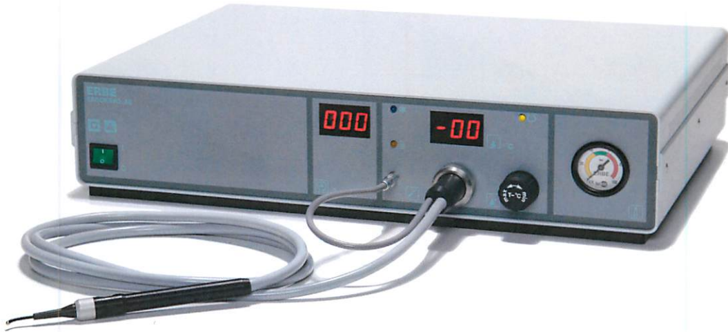
10731-002 冷凍手術装置AE 本体 (50/60Hz 100V) 電源コード付き