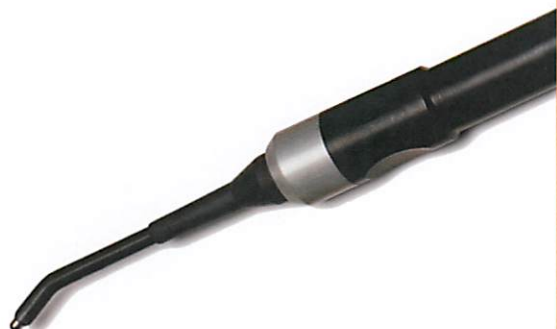
20711-084 網膜剥離用 10mm T型・温度表示有