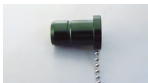
汎用照明アダプター アルコン社(アキュラス)、 グリスハーバー社

照明付プローブを使用する場合は、各照明装置に対応する専用のアダプターが必要となります。