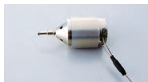
フォトン用 照明アダプター シナジェティクス社(フォトン)