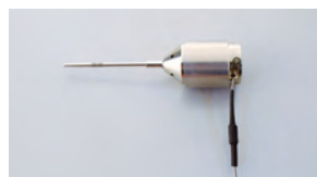
ブライトスター用 照明アダプター ドルク社(ブライトスター、LEDスター)