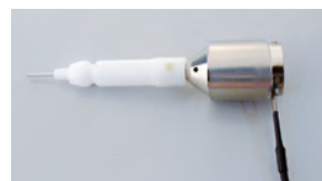
ステラリス用 照明アダプター ボシュロム社(ステラリス)